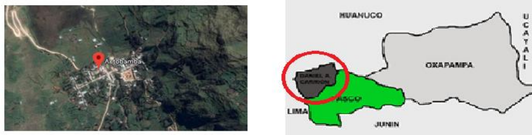
Fig. 1: Ubicación de Astobamba en la Provincia Daniel Carrión

La investigación se desarrolló en la jurisdicción del comité de regantes de Astobamba, distrito de Yanahuanca, Provincia Daniel Carrión, Región Pasco, a una distancia aproximada de 67 kilómetros de Cerro de Pasco. Geográficamente, el inicio de la línea de distribución N° 02 del sistema de riego de Astobamba, se localiza en las coordenadas 10° 29' 25" de Latitud Norte y 76° 30' 51" de Longitud Oeste. De acuerdo a Holdridge (1971), la zona de vida corresponde a un bosque húmedo Sub Alpino Tropical (bh-SaT).